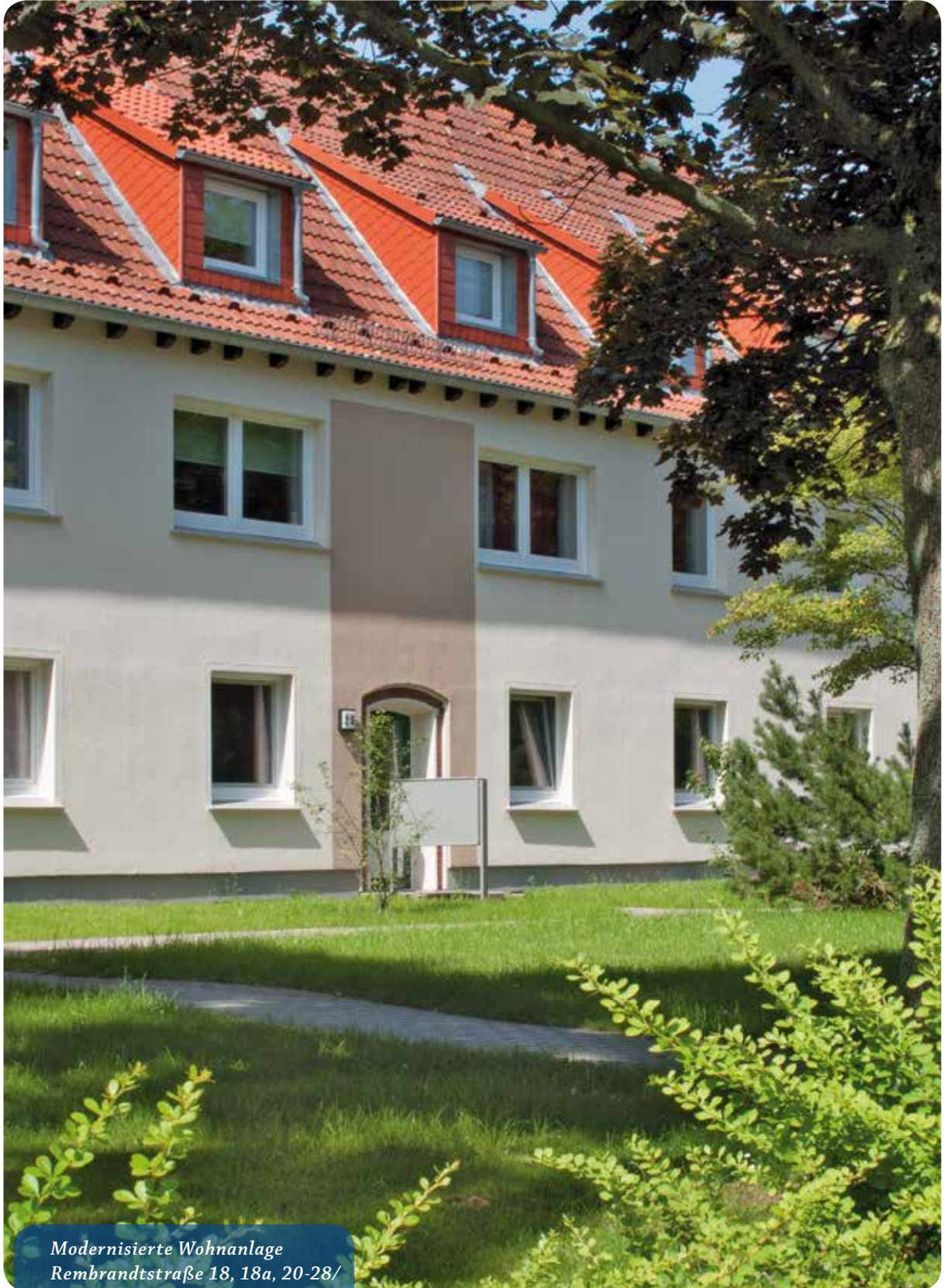
Modernisierte Wohnanlage Rembrandtstraße 18, 18a, 20-28/ Sudermannstraße 33-37 21077 Hamburg, VE 6