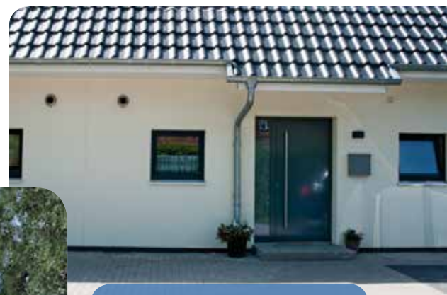
Neubau Einfamiliendoppelhaushälfte Scheidebachtal 18 a+b Waldfrieden-Siedlung, 21147 Hamburg, VE 2