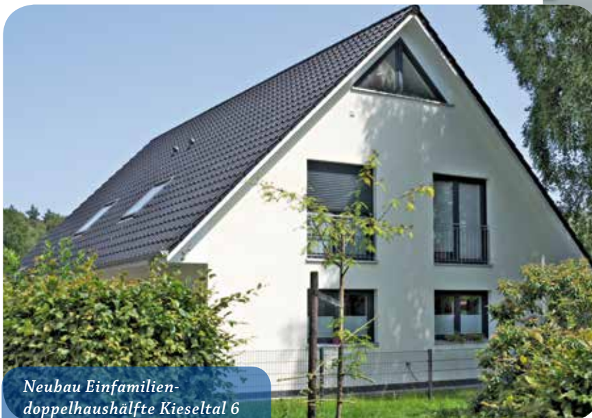
Neubau Einfamiliendoppelhaushälfte Kieselstal 6 Waldfrieden-Siedlung, 21147 Hamburg, VE 2

Wir werden unsere Neubautätigkeit auch in der Zukunft am langfristig vorhandenen Bedarf orientieren und den Senat bei der wohnungspolitischen Zielsetzung,