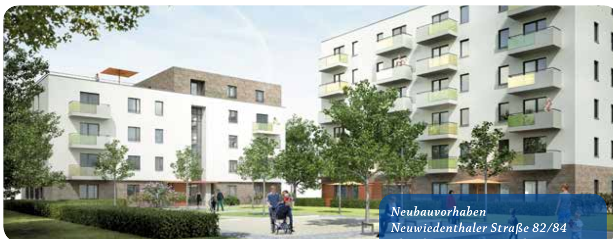
Neubauvorhaben Neuwiedenthaler Straße 82/84 Planskizze; 21147 Hamburg, VE 23

Die Baugenehmigung liegt zwischenzeitlich vor. Vorgesehen ist die Errichtung von 26 Wohnungen und 30 Kfz-Stellplätzen. Ein Gebäude wird mit einem Fahrstuhl ausgestattet, bei den weiteren Gebäuden sind die Erdgeschosswohnungen barrierefrei zu erreichen. Die Gebäude werden nach dem Standard des KfW-Effizienzhaus-70 errichtet. Unseren Mitgliedern können wir nach Fertigstellung eine attraktive Wohnanlage mit interessanten Grundrissen anbieten. Die Gebäude bieten von einer 2 Zimmerwohnung (56 m 2 ) bis zur 3 1/2 -Zimmerwohnung (94 m 2 ) eine große Typenvielfalt für die unterschiedlichen Wohnbedürfnisse aller Altersgruppen. Durch den Einbau des Fahrstuhls eignen sich eine Vielzahl der Wohnungen für barrierefreies und altersgerechtes Wohnen. Eine Förderung