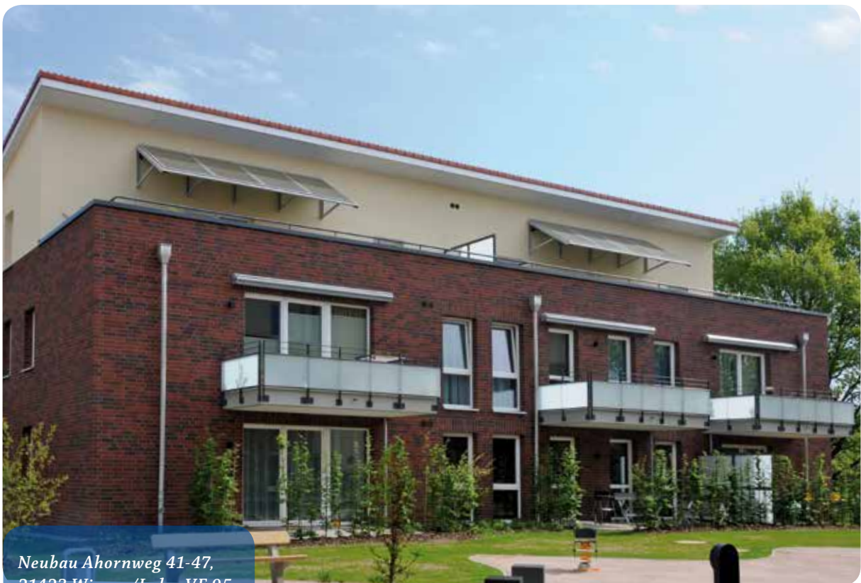
Neubau Ahornweg 41-47, 21423 Winsen/Luhe, VE 95