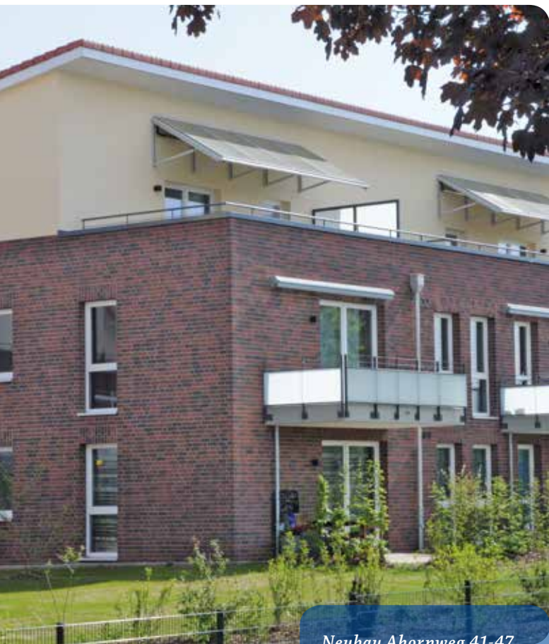
Neubau Ahornweg 41-47, 21423 Winsen/Luhe, VE 95

Mit einer Bruttowertschöpfung von über 434 Milliarden Euro und einem Anteil von ca. 19% an der gesamten Bruttowertschöpfung ist die Immobilienwirtschaft in Deutschland eine der größten Wirtschaftszweige. Die Grundstücks- und Wohnungswirtschaft als Kernbereich der Immobilienwirtschaft verzeichnete 2013 dabei ein überdurchschnittliches Wertschöpfungsplus von 0,9%. Während die Wirtschaftsleistung des Baugewerbes insgesamt in 2013 um 1,2% sank, zeigte der Wohnungsbau als Teilbereich des Baugewerbes mit einem Zuwachs von 0,3% im Jahr 2013 nun im vierten Jahr in Folge eine aufwärtsgerichtete Tendenz. Die Wohnungsbauinvestitionen der Unternehmen des Verbandes norddeutscher Wohnungsunternehmen e.V. (VNW) sind geprägt von ökonomischer, gesellschaftlicher, sozialer und ökologischer Verantwortung. Sie sind nicht am schnellen Profit orientiert, sondern auf langfristig attraktive Wohnungsbestände ausgerichtet.